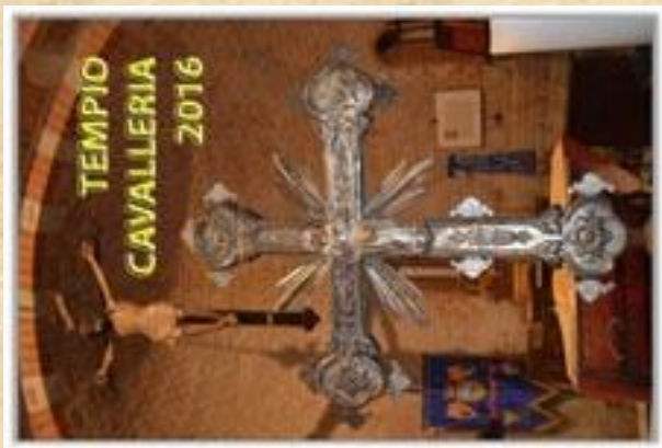
Riproduzione della Tessera da Patrono 2016 che verrà consegnata subito dopo la commemorazione di San Giorgio, ai Patroni presenti alla cerimonia religiosa.

Si consiglia a quanti dovessero servirsi del Bollettino Postale, di scrivere direttamente al Priore avvertendolo dell'avvenuto pagamento, allegando copia del bollettino, ciò a causa delle comunicazioni ritardate che fa la posta.